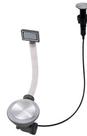
Desagüe automático Space Push - PP 8407 116