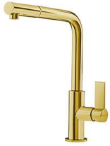
Monomando Omega Plus Gold 8498 859