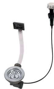
Desagüe automático 8407 000