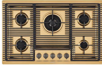
Placa de cocción Milanello Gold 5F 7682 009