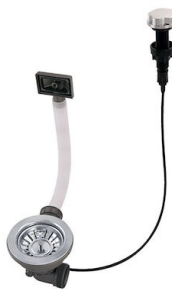
Desagüe automático 8407 100