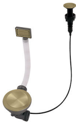
Desagüe automático Space Push Gold 8407 121